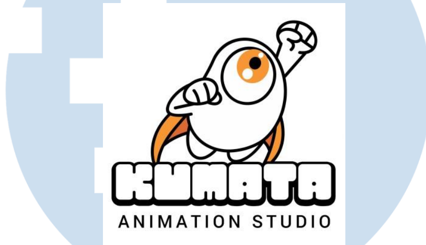
Gambar 2.1 3 Logo Kumata Studio