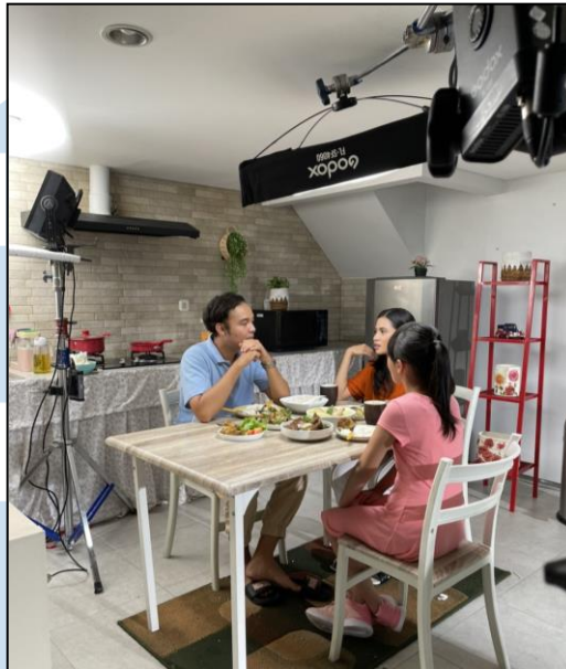
Gambar 3.4 Behind The Scene Produksi Homeal