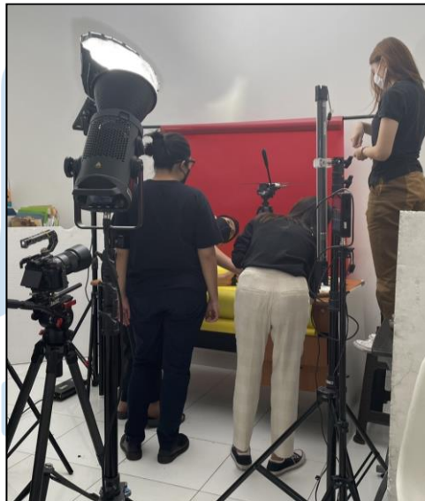
Gambar 3.3 Behind The Scene Produksi Video Product Coca Cola, Fanta & Dear Butter