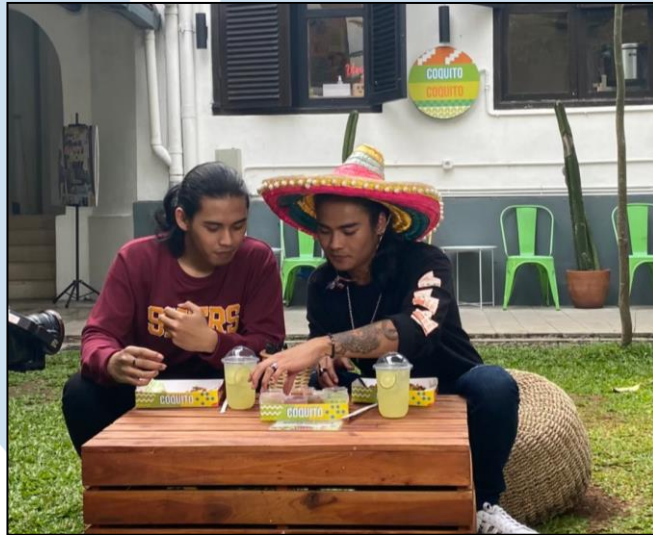
Gambar 3.2 Behind The Scene Produksi Dens Tv “Icip Skuy”

konten-konten menarik melalui media sosial untuk dapat menginspirasi para pasangan. Candid Production dipercaya untuk membuat berbagai konsep beserta konten yang ingin dipublikasikan kepada media sosial dari The Bride Dept. Project dikerjakan secara online pada bulan April 2022 dengan membuat seluruh konsep dan mempresentasikannya kepada Klien.