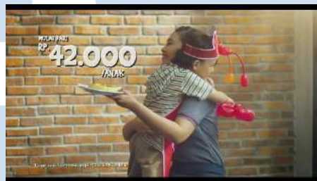
Gambar 2.2 Pizza Maker Junior 2019 – 30”

Dalam mengerjakan beberapa project dari penyusunan konsep kreatif hingga produksi, Candid Production bekerja sama dengan beberapa perusahaan yang menginginkan produk atau jasanya dikenal oleh audiens lewat digital advertising atau iklan yang berbasis digital . Beberapa perusahaan juga memakainya untuk tujuan komersial, yang diunggah pada sosial media dan disiarkan secara luas melalui jaringan televisi. Pada tahun 2019, Candid Production telah bekerja sama dengan beberapa perusahaan seperti Telkomsel, Polibest, Pizza Hut, Ramayana, dan P&G. Salah satu hasil produksi dari Candid Production, yaitu TVC Pizza Maker Junior mampu meraih sebanyak 3,6 juta penonton di YouTube.