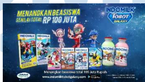
Gambar 2.3 Indomilk Tobot Galaxy (Dokumentasi Perusahaan, 2022)

Selain itu, Candid Production juga berkarya secara kreatif dalam dunia animasi, baik 2D maupun 3D. Salah satu perusahaan yang pernah bekerja sama dengan Candid Production untuk pembuatan TVC dengan jenis animasi adalah Indomilk Tobot Galaxy pada tahun 2020. Untuk menghasilkan produksi dengan animasi sepanjang video, Candid Production biasanya akan hiring beberapa 3D Animator .