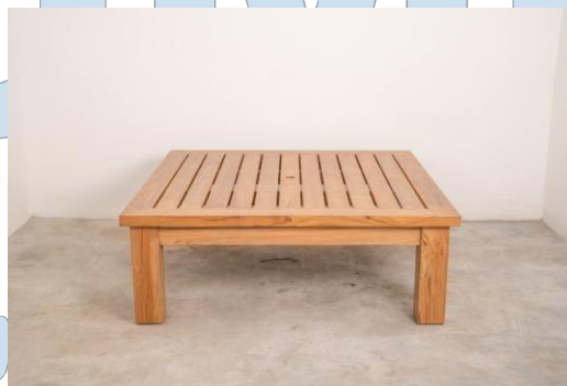
Gambar 2.1 Produk CV. Twindo Arsip Perusahaan (2022)

Contoh produk yang diproduksi oleh CV. Twindo: