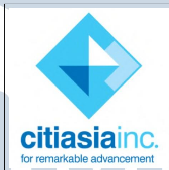
Gambar 2.1. Logo PT Citiasia Internasional

PT Citiasia Internasional atau dikenal sebagai Citiasia Inc. merupakan sebuah perusahaan konsultan manajemen yang berfokus pada pembangunan smart city . Citiasia Inc. menyediakan layanan terintegrasi melalui unit institute, consulting, dan development . Citiasia Inc. sendiri memiliki visi untuk mendukung kemajuan pembangunan di Indonesia melalui gerakan Indonesia Smart Nation untuk mewujudkan bangsa Indonesia sebagai bangsa pintar. Gerakan ini telah digagas sejak tahun 2015 yang dijalankan oleh lini strategisnya yaitu Citiasia Center for Smart Nation atau CSSN. Untuk mewujudkan hal tersebut, Citiasia Inc. membangun kemitraan dan kerja sama dengan berbagai pihak kementerian dan lembaga pemerintahan, serta organisasi internasional dan pemerintah daerah yang ada di Indonesia [3].