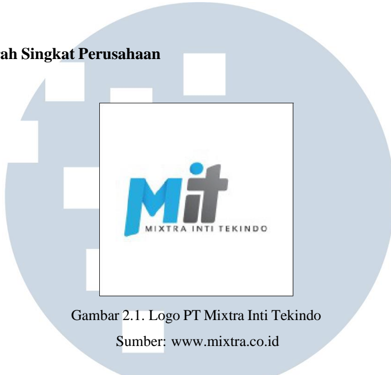
Gambar 2.1. Logo PT Mixtra Inti Tekindo