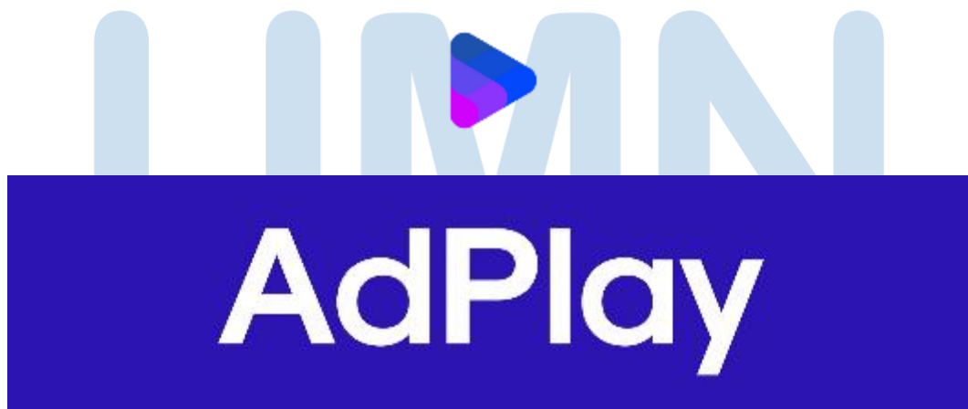
Gambar 2.1 Logo Perusahaan Adplay Media Indonesia

Adplay Media Indonesia merupakan suatu rumah produksi independen yang dibangun sejak tahun 2020. Bergerak dalam industri kreatif baik mulai dari perancangan ide atau pre-production , production hingga post-production . Visi dari Adplay Media Indonesia adalah “ To make advertisements worth playing ”, dengan misi yang dibawa adalah “ Creating deliverables that exceed client's expectation ”. Rumah produksi ini dibentuk dengan harapan memberikan fresh graduate dan internships hands-on experience dalam dunia kerja yang mereka butuhkan dengan memberikan tugas yang mempunyai dampak langsung terhadap project klien. Dengan begitu, internships dapat belajar bertanggung jawab, professional work ethics , dan industry experience secara menyeluruh. Dimulai dengan beranggotakan satu orang sekarang Adplay Media Indonesia memiliki kurang lebih delapan pekerja. Dalam project tertentu Adplay menggunakan alih daya ( outsourcing ) untuk mempermudah pengerjaan dan penyelesaian suatu project klien.