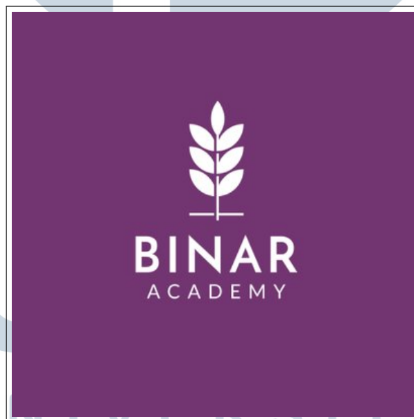
Gambar 2.1. Logo perusahaan Binar Academy.

PT. Lentera Bangsa Benderang (Binar Academy) adalah sebuah startup edukasi bagi talenta pemrograman yang didirikan pada tahun 2017 oleh mantan CTO Gojek Alamanda Shantika [4]. Sebelumnya, Binar Academy memiliki akademi pemrograman dengan fasilitas beasiswa penuh di Yogyakarta dengan menjangkau berbagai komunitas talenta digital di berbagai daerah. Pada akhirnya, Binar Academy menyadari kebutuhan akan pembelajaran pemrograman tidak hanya lagi dibutuhkan oleh spesialis pemrograman. Pembelajaran intensif mengenai keterampilan tersebut juga dibutuhkan oleh berbagai kalangan untuk mempelajari bahasa pemrograman dari nol [5]. Gambar 2.1 merupakan logo perusahaan Binar Academy [6].