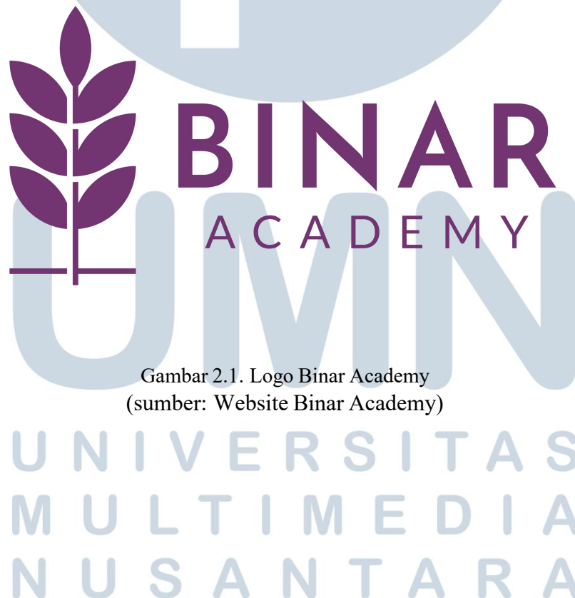
Gambar 2.1. Logo Binar Academy