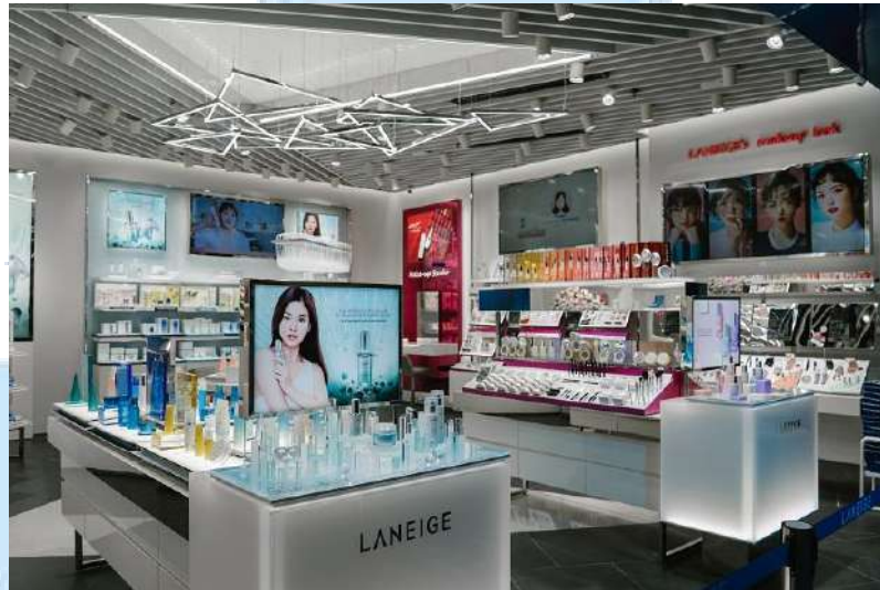
Gambar 2. 3 Butik Laneige di Pondok Indah Mall 1