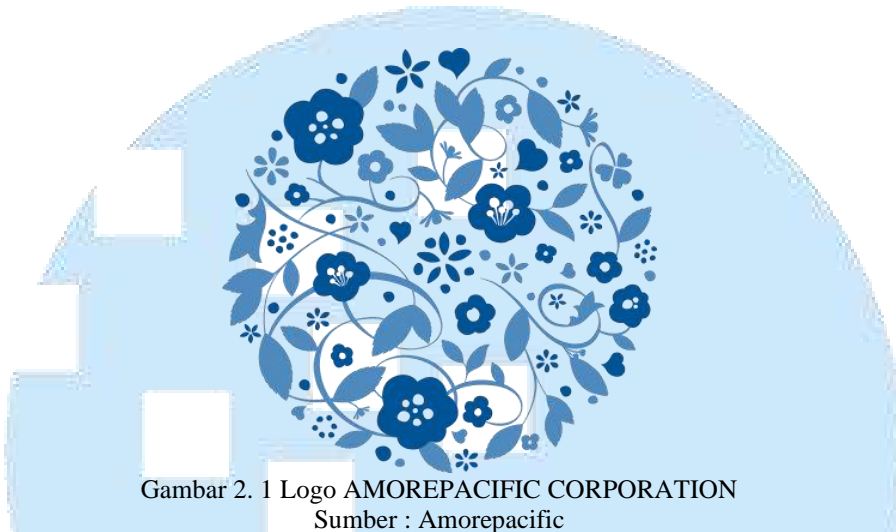
Gambar 2. 1 Logo AMOREPACIFIC CORPORATION