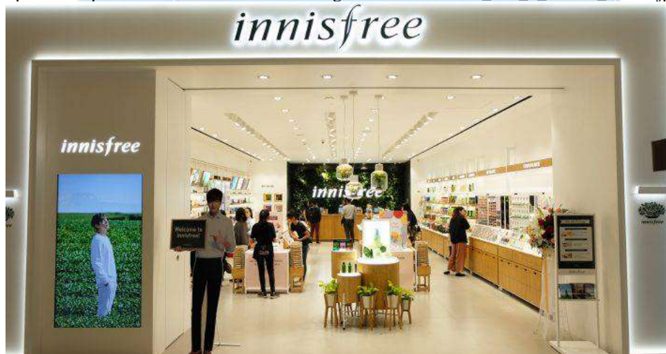
Gambar 2. 4 Butik Innisfree di Grand Indonesia

https://www.pondokindahmall.co.id/assets/img/news/1520320492_185_0_RNDR_06378.jpg