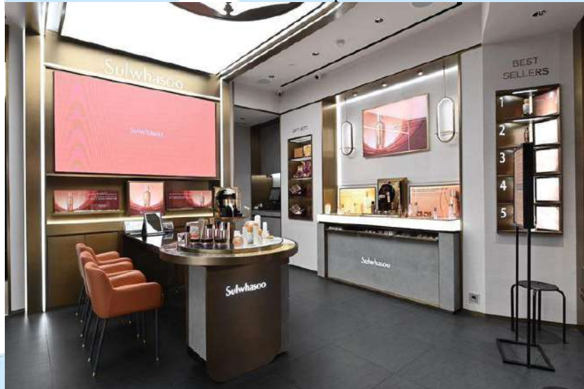
Gambar 2. 2 Butik Sulwhasoo di Plaza Indonesia