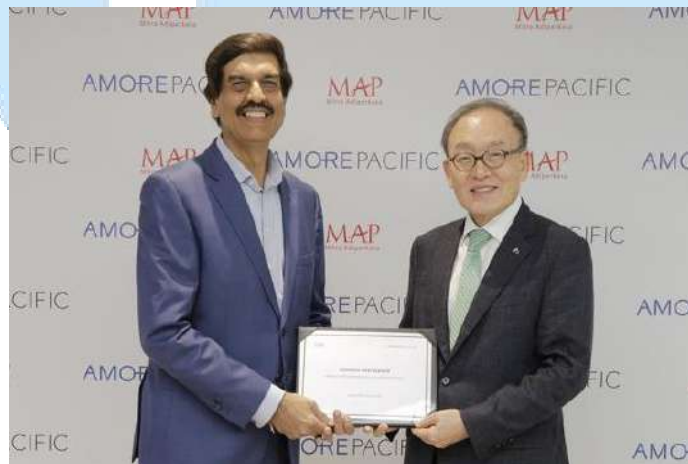
Gambar 2. 5 Penandatanganan Kerjasama AMOREPACIFIC dengan MAP Dong-hyun Bae, Presiden AMOREPACIFIC Group (Kanan), V.P Sharma, CEO MAP (Kiri)

PT. Laneige Indonesia Pacific juga bekerja sama dengan PT. Mitra Adi Perkasa (MAP) untuk mengoperasikan merek - merek dibawah naungan MAP. Kerjasama ini dijalin dengan harapan melalui MAP, merek - merek milik PT. Laneige Indonesia Pacific dapat diperluas jangkauannya tidak hanya pada Jakarta tetapi juga Bali, Bandung, Surabaya dan daerah lainnya (Prnasia, 2020).