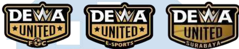
Gambar 2.2 Logo 3 Divisi Dewa United

4. Bergabung dengan berbagai acara resmi dan besar di tingkat nasional dan internasional.