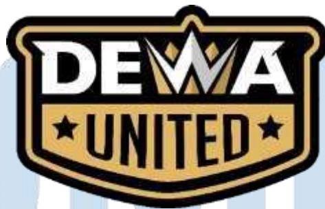
Gambar 2.1 Logo Dewa United

Dewa United merupakan sebuah grup olahraga yang didirikan pada tahun 2020 dan memiliki tiga divisi olahraga utama yaitu sepak bola, bola basket, dan E-Sports . Hadirnya Dewa United adalah tidak lain untuk turut memajukan dan meramaikan dunia olahraga Indonesia. Dewa United dalam industri Olahraga memiliki komitmen besar untuk berkontribusi pada ekosistem olahraga dengan menyediakan tim manajemen terbaik, pemain terbaik, sistem rekrutmen yang adil sambil membangun basis penggemar dan komunitas yang kuat, dan membawa hiburan olahraga ke level berikutnya. Adapun Visi yang dibuat oleh Dewa United adalah Veni, Vidi, Vici yang memiliki arti bahwa Dewa United dibentuk untuk menjadi pemenang, tidak hanya menang dalam pertandingan, tetapi juga memenangkan hati seluruh masyarakat dan pecinta olahraga di Indonesia. Dewa United bertujuan untuk menjadi tim olahraga terbaik dan membantu memperkuat serta mendukung ekosistem olahraga di Indonesia dan Internasional.