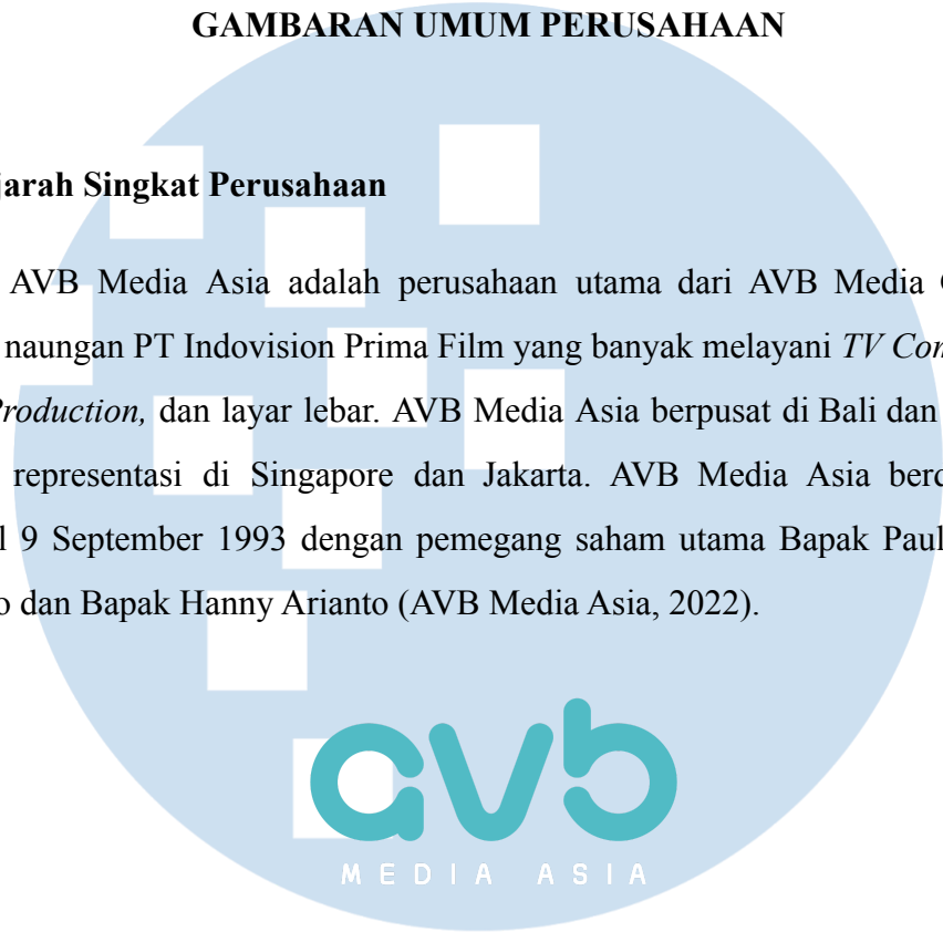
Gambar 2.1 Logo Perusahaan AVB Media Asia