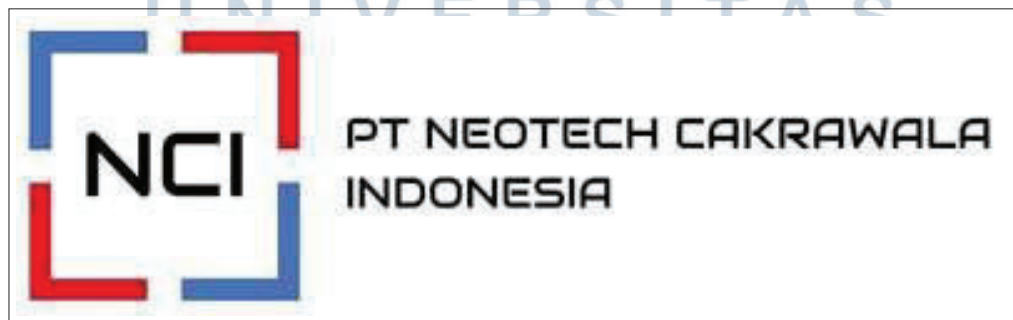
Gambar 2.1. Lambang Perusahaan PT Neotech Cakrawala Indonesia

PT Neotech Cakrawala Indonesia sudah bekerja sama dengan beberapa perusahaan ternama seperti BRI Life, Modena Start Living dan HINO. PT Neotech Cakrawala Indonesia juga bekerja sama dengan kementerian seperti Kementerian Pendidikan dan Kebudayaan serta Kementerian Kesehatan Republik Indonesia.