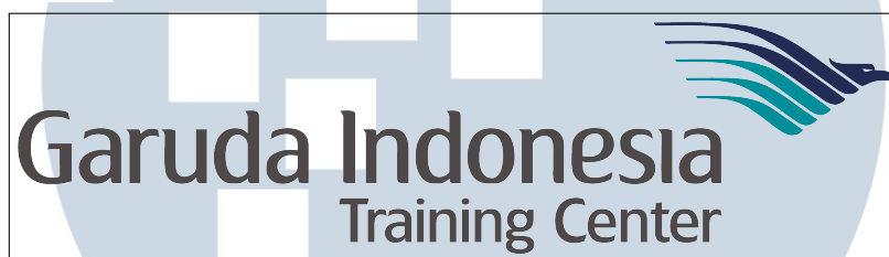
Gambar 2.1. Logo Garuda Indonesia Training Center

Garuda Indonesia Training Center merupakan pusat pendidikan pelatihan berstandar Internasional yang didirikan Garuda Indonesia untuk mendidik cabin crew terpilih, teknisi dan pilot.