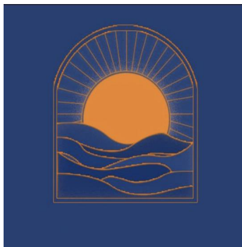
Gambar 2. 1 Logo Assa Kreatif