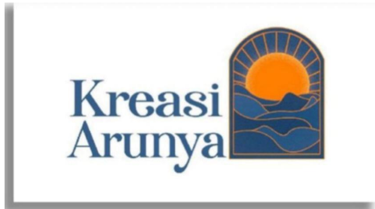
Gambar 2. 2 Logo hasil rebranding menjadi Kreasi Arunya