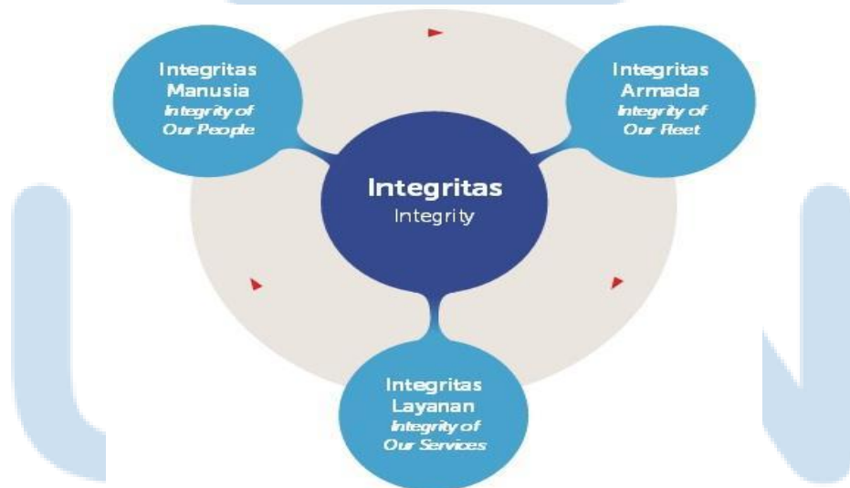
Gambar 2. 2 Nilai pada PT. Jasindo Jaya Pacific

PT. Jasindo Jaya Pacific menerapkan nilai-nilai acuan kerja dimana dengan pusat nilai Integritas. Menurut Mulyadi (dalam Retnowati, E., & Sinambela, 2019), integritas adalah tentang sikap seseorang yang jujur dan transparan secara konsisten tanpa menutupi rahasia penerima layanan, jasa, dan kepercayaan publik demi keuntungan pribadi, dimana integritas sebagai bentuk profesionalisme benchmark dan public trust terhadap kualitas baik dalam penilaian dan pengambilan keputusan. Berikut tiga nilai dasar yang diimplikasikan PT. Jasindo Jaya Pacific: