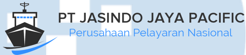
Gambar 2. 1 Logo Perusahaan

PT Jasindo Jaya Pacific atau JJP merupakan perusahaan pelayaran yang berpusat di Kota Batam. Perusahaan ini telah beroperasi sejak 17 Januari 2006 dengan memiliki 10 kapal yang masih aktif dan tersebar di beberapa lokasi. PT Jasindo Jaya Pacific merupakan perusahaan yang bergerak dalam bidang pelayaran yang berpusat di Batam, Kepulauan Riau. Dengan kepercayaan dan kerjasama dengan klien, secara aktif saat ini beroperasi ke berbagai wilayah di Indonesia. Jasindo Jaya Pacific memiliki Armada yang terdiri dari 1 harbour tug dan 12 pasang kapal yang terdiri dari 7 SPOB dan 5 Tugboat dan Oil Barge. PT. Jasindo Jaya Pacific mampu memberikan jasa untuk membangun, mengoperasikan, dan menjadi broker perusahaan lainnya.