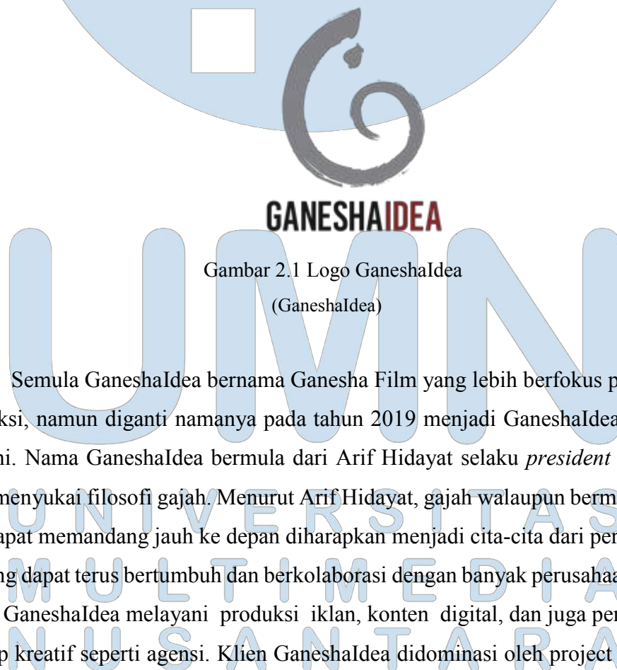
Gambar 2.1 Logo GaneshaIdea (GaneshaIdea)

GaneshaIdea adalah perusahaan produksi iklan dan konten digital yang didirikan pada tahun 2016. Rumah produksi GaneshaIdea sendiri berlokasi di Jl. Benda no. 90, Kemang, Jakarta Selatan, Indonesia. GaneshaIdea dibawah oleh PT. Swa Karsa Daya Karya yang sengaja memakai nama PT tersebut karena sudah terbentuk terlebih dahulu. Radityo Trinugroho sendiri menjelaskan alasan mengapa kerap ada nama perusahaan yang tidak sama dengan nama PT nya dengan alasan untuk menang tender kadangkala dibutuhkan rentang usia PT yang lebih dari tiga tahun untuk dipercaya sebagai sebuah perusahaan yang kredibel.