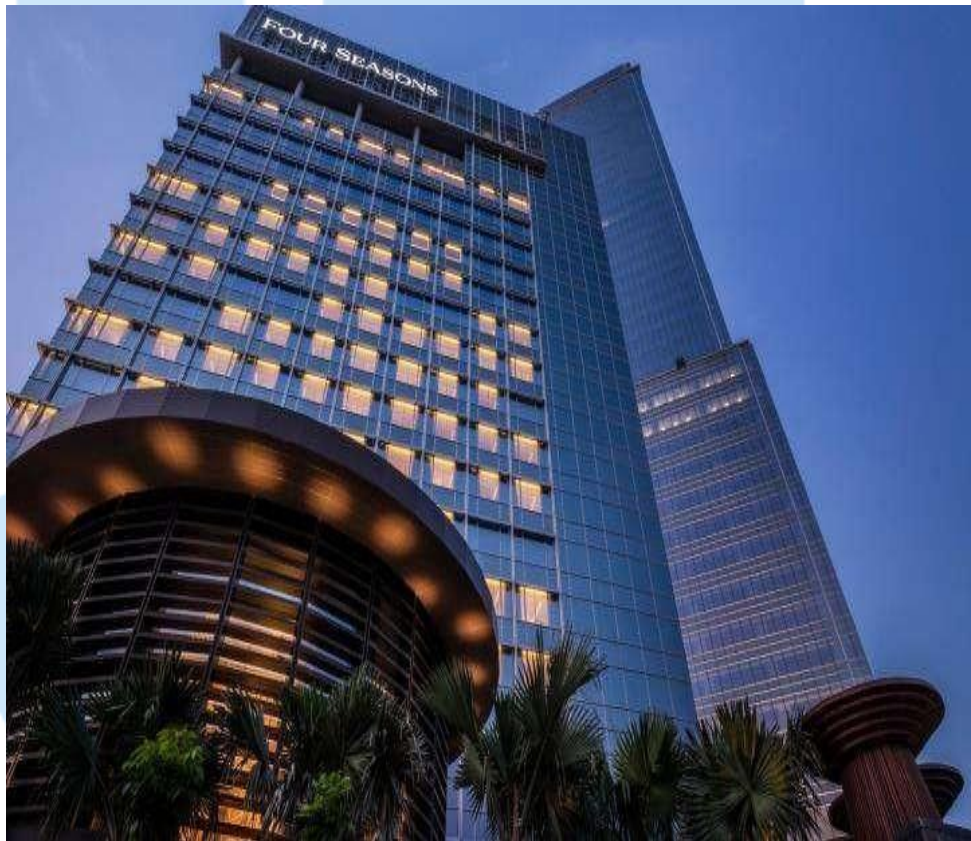
Gambar 2. 2 Bangunan Four Seasons Hotel Jakarta