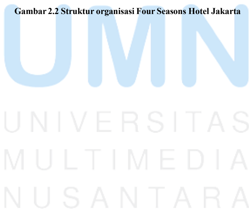
Gambar 2.2 Struktur organisasi Four Seasons Hotel Jakarta