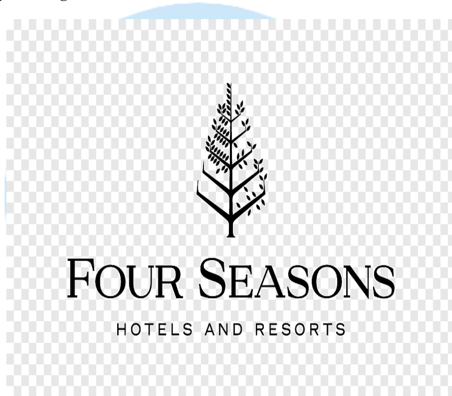
Gambar 2. 1 Logo Four Seasons Hotel Jakarta