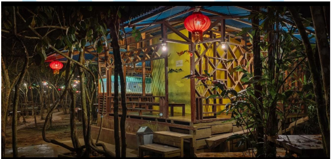
Gambar 2.1 Suasana Pondok Alam Sosok pada Pagi dan Malam Hari