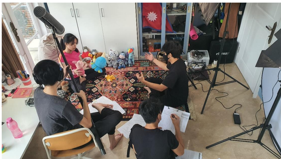
Gambar 3.5 Behind The Scene Proyek Kognisi Youth Film Festival

Sebelum shooting dilaksanakan, penulis bersama tim videographer menuju ke lokasi untuk set tempat. Di tahap selanjutnya, penulis bersama tim videographer merekam foley dan voice-over di lokasi. Penulis kemudian membuat dokumen untuk laporan pengeluaran dana proyek tersebut. Hasil dari shooting dan sesi rekam suara dinyatukan oleh tim videographer kemudian dikumpulkan ke festival ketika diberi lampu hijau oleh CEO lewat sesi asistensi yang dijadwalkan oleh penulis.