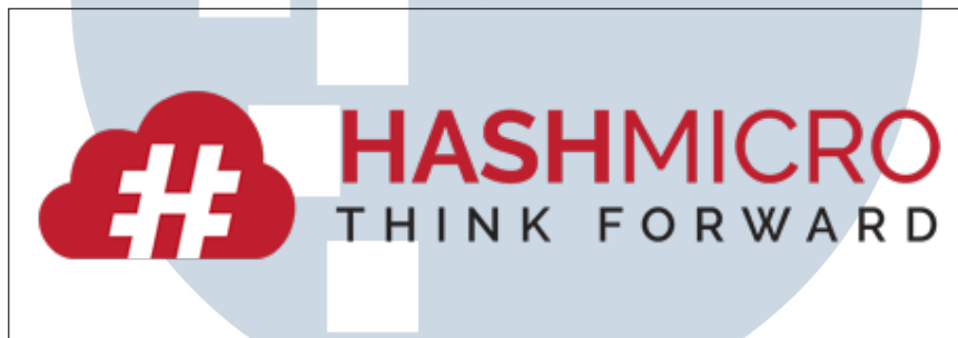
Gambar 2.1. Logo PT. Hashmicro Solusi Indonesia

Hashmicro adalah perusahaan penyedia solusi ERP yang mengedepankan unsur produktivitas dan efisiensi. Hashmicro percaya bahwa solusi otomatis ERP dapat memaksimalkan potensi perusahaan untuk dapat terus bersaing secara global. Hingga sampai saat ini, Hashmicro telah membantu lebih dari 350 klien dengan 35000 pengguna aktif dengan menghadirkan lebih dari 40 solusi dalam 15 industri. Logo PT. Hashmicro Solusi Indonesia dapat dilihat pada Gambar 2.1.