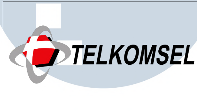
Gambar 2.1. Logo Perusahaan PT. Telekomunikasi Selular

Selama lebih dari 20 tahun, Telkomsel telah banyak berkontribusi untuk Indonesia terutama dalam sektor telekomunikasi, Telkomsel telah banyak memfasilitasi masyarakat Indonesia untuk dapat berkomunikasi melalui jalur digital.