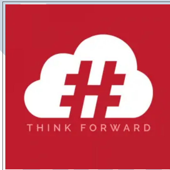
Gambar 2.1. Logo PT Hashmicro Solusi Indonesia [1]

PT Hashmicro Solusi Indonesia merupakan sebuah perusahaan yang bergerak di bidang ERP ( Enterprise Resource Programming ). PT Hashmicro Solusi Indonesia berdiri pada tahun 2015. PT Hashmicro Solusi Indonesia kini mempunyai 250 (Dua ratus lima puluh) karyawan, 250 (Dua ratus lima puluh) klien, 40 (Empat puluh) modul dan melayani 15 industri [6]. Di Indonesia PT Hashmicro Solusi Indonesia memiliki 2 (dua) kantor di Jakarta dan Surabaya.