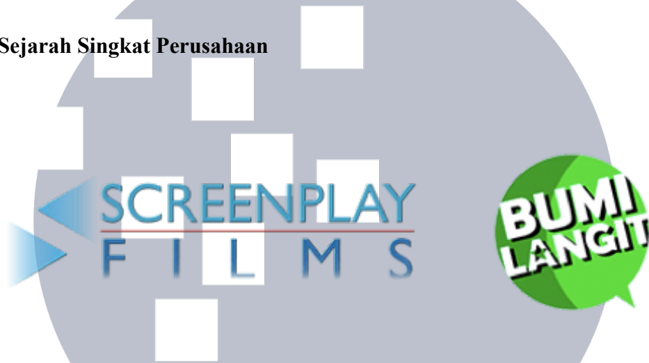
Gambar 2.1 Logo Perusahaan

PT. Screenplay Bumilangit Produksi merupakan perusahaan partnership dari Bumilangit Studio dan Screenplay Films. PT. Screenplay Bumilangit Produksi bergerak di bidang industri kreatif sebagai perusahaan rumah produksi di Indonesia yang fokus memproduksi film maupun series dengan mengangkat karakter-karakter komik legendaris Indonesia dan budaya pop Indonesia. Dimana, nantinya serangkaian film dan series tersebut akan diperkenalkan melalui Jagat Sinema Bumilangit. PT. Screenplay Bumilangit Produksi atau yang lebih dikenal dengan Screenplay Bumilangit didirikan pada tanggal 3 Agustus 2018.