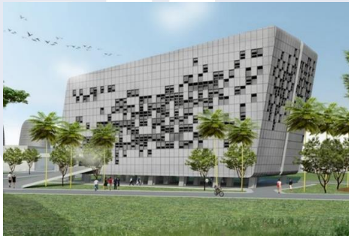
Gambar 2.2 Lokasi Gedung Multimedia Nusantara Polytechnic

Kampus Multimedia Nusantara Politeknik berlokasi di Gading Serpong, Kelapa Dua, Kabupaten Tangerang dengan bangunan di atas lahan seluas 80.000 M Persegi, dengan bangunan kampus seluas 13.300 meter persegi dan terdiri dari lima lantai.