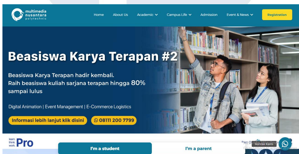
Gambar 2.1 Website Perusahaan Multimedia Nusantara Politeknik

Multimedia Nusantara Polytechnic merupakan perguruan tinggi vokasi yang didirikan pada tanggal 18 September 2021 oleh Yayasan Multimedia Nusantara, sebuah badan penyelenggara yang telah berhasil mendirikan dan mengembangkan Universitas Multimedia Nusantara dengan akreditasi unggul (A) dan BAN-PT. Sebagai bagian dari Grup Kompas Gramedia, Multimedia Nusantara Polytechnic memiliki jejaring aktif dengan industri dari berbagai bidang seperti media, retail & publishing, hospitality, manufacture, event & venue, property dan digital.