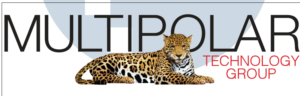
Gambar 2.1. Logo Perusahaan PT. Multipolar Technology Tbk.

Multipolar Technology Tbk pada Gambar 2.1 merupakan anak perusahaan dari Multipolar Tbk Gambar 2.2 yang bergerak di bidang teknologi dan sudah berdiri sejak tahun 1975. Multipolar Technology memiliki berbagai layanan teknologi diantaranya adalah Hybrid Infrastructure Platforms & Services , Hybrid Integration Platforms & Services , Business Solution Platforms & Services , Digital Insights , Customer Experience Platforms & Services , Strategy & Planning , serta Security Platforms & Services dan sudah dengan standar sertifikasi ISO 9001[1].