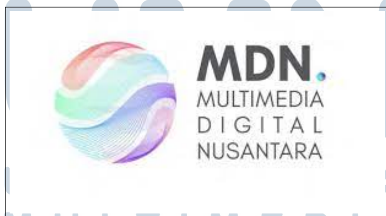
Gambar 2.1. Logo PT. Multimedia Digital Nusantara