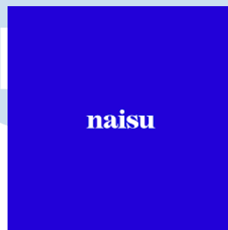
Gambar 2.1 Logo Naisu Studio