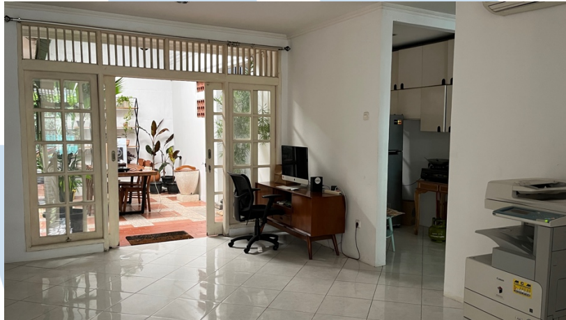
Gambar 2.2 Kantor Black Orchid Film

untuk finance , dan satu gudang untuk penyimpanan wardrobe yang digunakan saat shooting .