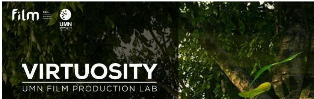
Gambar 2.2 logo Virtuosity UMN Film Production Lab