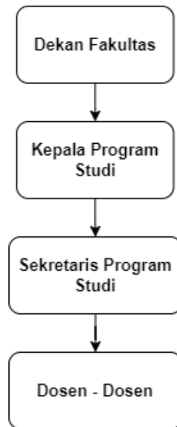
Gambar 2. 6 Struktur Organisasi Prodi Sistem Informasi

Sedangkan, Berikut merupakan struktur organisasi di dalam lingkup Prodi Sistem Informasi