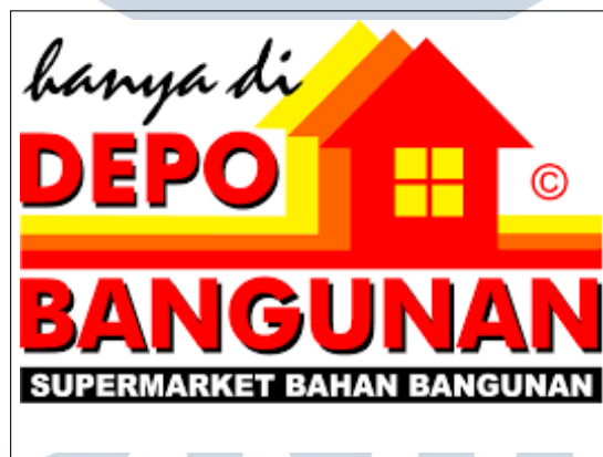
Gambar 2.1. Logo Perusahaan Depo Bangunan