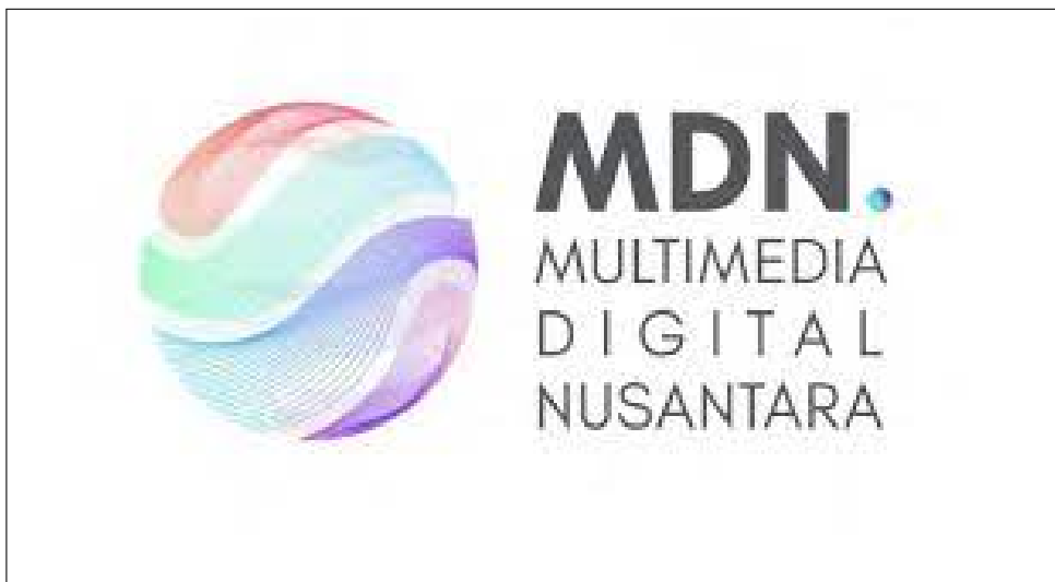
Gambar 2.1. Logo PT Multimedia Digital Nusantara

Pada tahun 2017, UMN Pictures pertama kali didirikan oleh Bapak Teddy SURIANTO yang merupakan eksekutif di dalam grup Kompas Gramedia. Tujuan dibentuknya UMN Pictures adalah untuk menjadi studio yang diakui secara nasional dan internasional yang mampu menciptakan dan mengembangkan Kekayaan Intelektual (IP) ke berbagai media seperti animasi, film, dan game. Tiga tahun setelah UMN Pictures dibentuk, PT MDN didirikan dan UMN Pictures dijadikan sebagai salah satu divisi di dalam PT MDN. Pada tahun ini juga, PT MDN membentuk divisi baru yang dinamakan UMN Consulting. UMN Consulting didirikan untuk memberi solusi perusahaan atau agensi melalui bantuan penelitian dan konsultasi. Dua tahun setelah PT Multimedia Digital Nusantara berjalan, pada Juli 2022, PT MDN membentuk divisi UMN Technology yang memiliki fokus dalam pengembangan Virtual Reality (VR) dan Augmented reality (AR), sistem internal, serta konsep metaverse . Gambar 2.1 merupakan logo dari PT Multimedia Digital Nusantara.