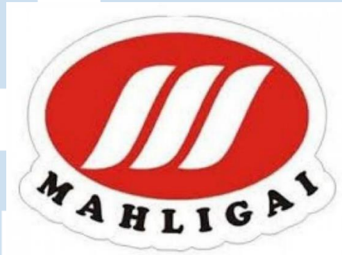
Gambar 2.1 Logo PT Mahligai Puteri Berlian

PT Mahligai Puteri Berlian ini merupakan sebuah perusahaan yang bergerak dalam industri transportasi khususnya beberapa dealer mobil Mitsubishi. Pada awalnya PT ini didirikan dengan nama PT Mahligai Putra Berkat namun pada tahun 2016 berganti nama menjadi PT Mahligai Puteri Berlian. PT Mahligai Puteri Berlian ini berada dibawah naungan Deta Group. PT Mahligai Puteri Berlian ini memiliki beberapa cabang dealer Mitsubishi yang tersebar di beberapa kota dalam Pulau Jawa, seperti contohnya Mitsubishi Mahligai Gardujati (Bandung), Mitsubishi Mahligai Cimahi (Bandung), Mitsubishi Mahligai Sukabumi, dan lainnya.