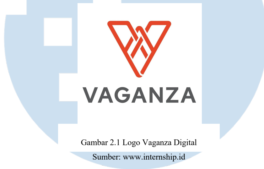
Gambar 2.1 Logo Vaganza Digital