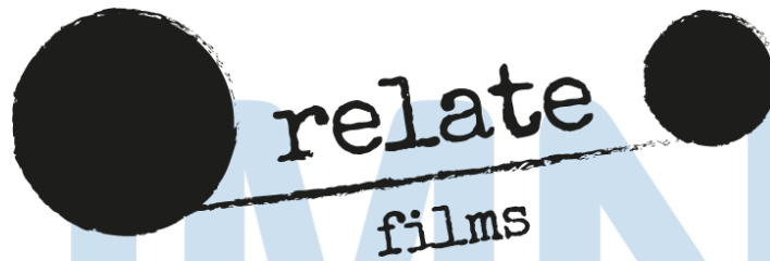
Gambar 2.2 Logo Relate Films