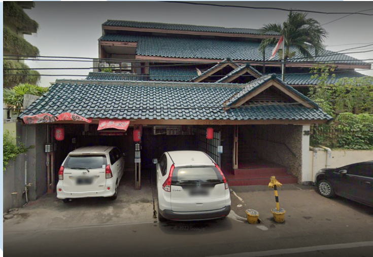
Gambar 2.1 Kantor Production House Relate Films