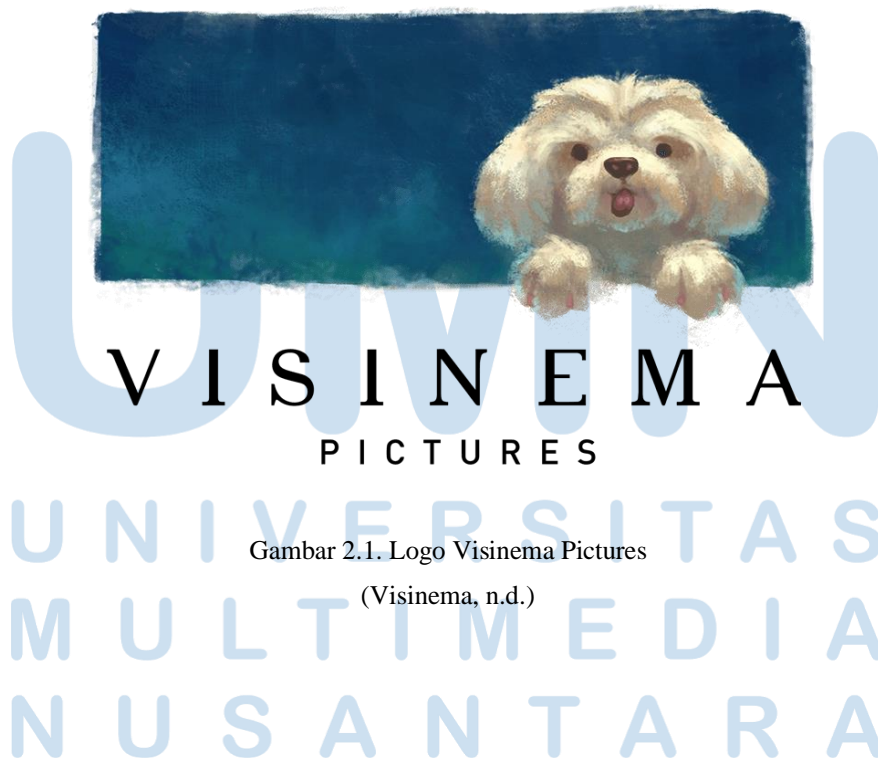
Gambar 2.1. Logo Visinema Pictures

PT. Visinema Pictures adalah sebuah perusahaan yang bergerak di bidang industri kreatif rumah produksi film, yang didirikan oleh Angga Dwimas Sasongko, Perusahaan ini berdiri sejak tahun 2008. PT. Visinema dibangun sebagai tempat atau wadah ide-ide kreatif, dan dibangun dengan visi yang besar yang mempunyai visi progresif yang bertujuan dapat menambah pandangan baru dalam sisi kehidupan masyarakat Indonesia. PT. Visinema dibangun dengan strategi bisnis yang tidak hanya membawa idealisme namun juga fleksibilitas dalam membangun perusahaan dan menghadapi tantangan. Selain itu karya-karya yang dibuat oleh anak-anak bangsa dalam membangun PT. Visinema memiliki visi dari hasil karya film mereka dalam menghasilkan karyanya untuk menghadirkan sudut pandang lain di tengah kehidupan masyarakat melalui karya-karya yang dibuat (Visinema, n.d.).