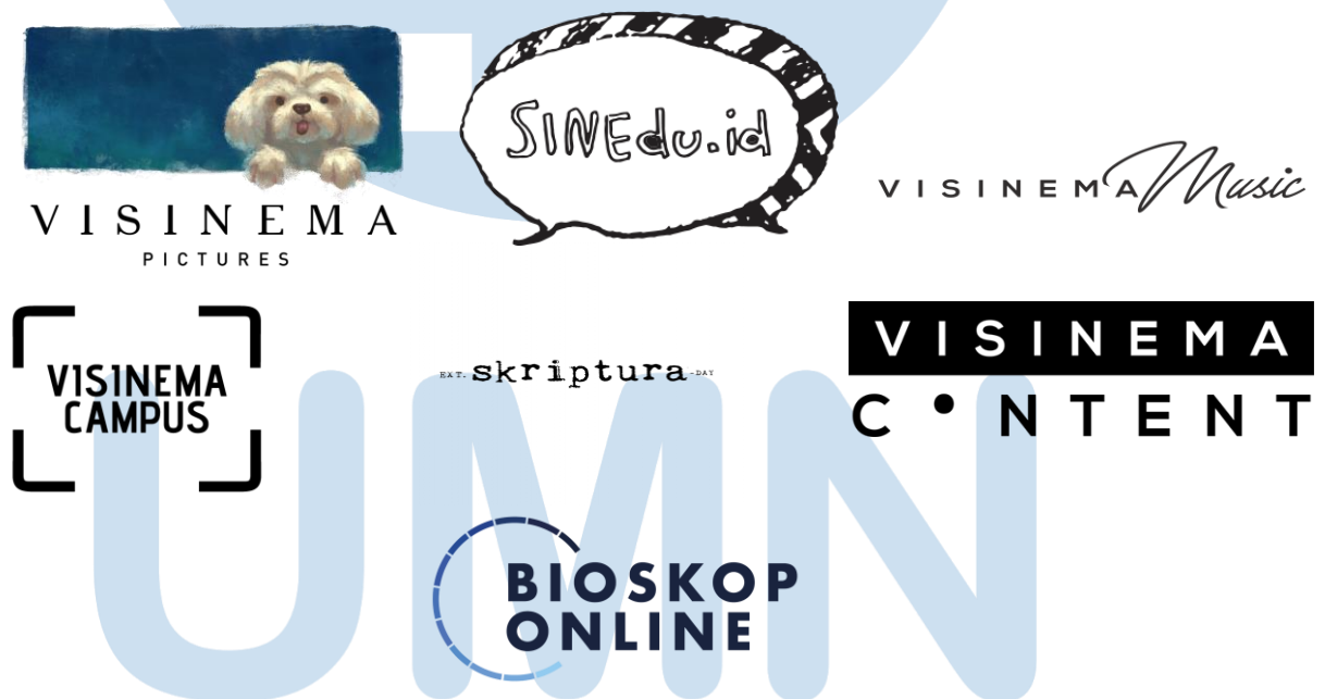
Gambar 2.2. Logo Visinema Pictures, Sinedu.id, Visinema Music, Visinema Campus, Skriptura, Visinema Content, Bioskop Online. (Visinema, n.d.)