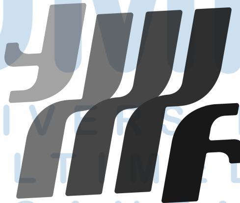
Gambar 2.1 Logo YWMF

YWMF memiliki visi menjadi penyedia solusi terkemuka untuk artis, brand dan korporasi dalam mencapai tujuan bisnis serta pemasaran mereka, melalui pengembangan solusi kreatif dan inovatif dalam industri yang terus berkembang. YWMF memiliki misi menjadi artist management terdepan di industri produksi digital Indonesia, meneliti pasar dan membedakannya dari kompetitor melalui inovasi, membuat dan mengembangkan loyal fans base , dan membangun kepercayaan dan kredibilitas (YWMF, 2022).