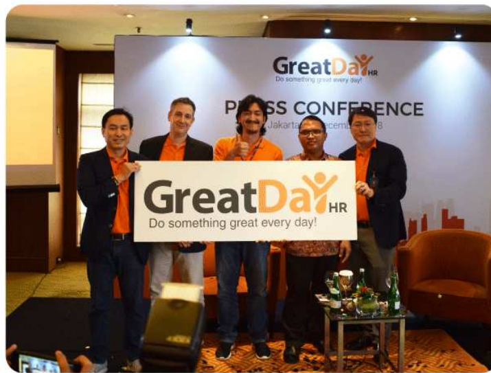
Gambar 2.1. Pengubahan nama produk SunFish Go menjadi GreatDay HR