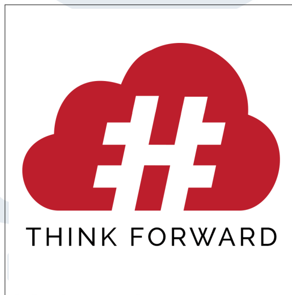
Gambar 2.1. Logo Perusahaan [1]

Pada tahun 2019 PT HashMicro Solusi Indonesia mendirikan sebuah Research and Development Center di Daerah Istimewa Yogyakarta setelah berkerja sama dengan pemerintah, institusi, dan instansi pendidikan baik sekolah maupun universitas. Berhasil melakukan ekspansi dan membangun Research and Development Center , dan melanjutkan ekspansinya dengan membuka cabang untuk Development Center di Surabaya pada tahun 2020 [3].