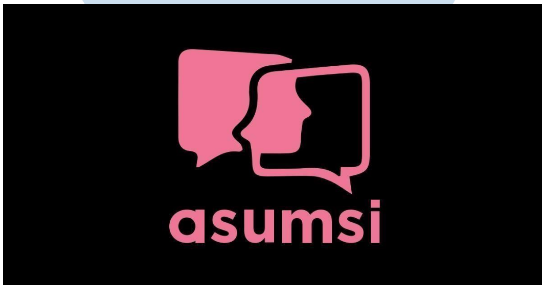
Gambar 2.1 Logo Asumsi

Asumsi merupakan sebuah media yang berfokus pada bahasan politik dan budaya pop, yang berdiri pada tahun 2015 oleh Pangeran Siahaan ( founder ) dan Iman Sjafei ( co-founder ). Karena satu dan lain hal, Iman Sjafei memutuskan untuk melepas jabatannya dari Asumsi, dan mempercayai Pangeran Siahaan untuk memimpin perusahaan Asumsi. Hingga saat ini, karyawan yang bekerja di Asumsi telah mencapai 100 orang. Asumsi terus berkembang dan berinovasi dalam segi program konten-konten menarik yang berkualitas dan digemari masyarakat. Asumsi memiliki pemilihan konten yang mendalam dan berbeda.