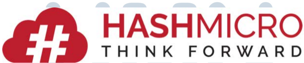
Gambar 2.1. Logo perusahaan PT Hashmicro Solusi Indonesia

PT Hashmicro Solusi Indonesia (Hashmicro) adalah Penyedia Perangkat Lunak Perencanaan Sumber Daya Perusahaan (ERP) didirikan di Singapura pada tahun 2015. Kantor utama Hashmicro terletak Jalan Balik papan Raya. No 9 A - C, Daerah Khusus Ibu kota Jakarta. Sebagai penyedia solusi ERP terkemuka, Hashmicro mencapai pentingnya produktivitas dan efisiensi bisnis dan aktif dalam perkembangan sistem berbasis cloud . Sistem ini mengotomatisasi semua operasi bisnis dan dapat disesuaikan dengan kebutuhan berbagai industri. Saat ini, Hashmicro memiliki lebih dari 40 modul dengan ribuan fitur yang telah berlokasi di lebih dari 15 industri di Indonesia dan Singapura. Dalam kegiatannya, Hashmicro memiliki visi yaitu menjadi bagian dari kemajuan bisnis di Indonesia dengan menyediakan solusi ERP terbaik untuk meningkatkan produktivitas dan bantuan bisnis untuk membuat keputusan yang terukur. Jika tidak, Hashmicro juga berusaha untuk mendapatkan keuntungan dari otomatisasi bisnis bagi banyak perusahaan di Asia. Dengan program magang Hashmicro menyelaraskan visi dan misinya dengan peserta sehingga peserta dapat ber-kontribusi untuk mencapai visi dan misi.