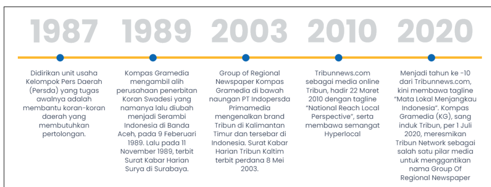
Gambar 2.1. Milestones Tribun News