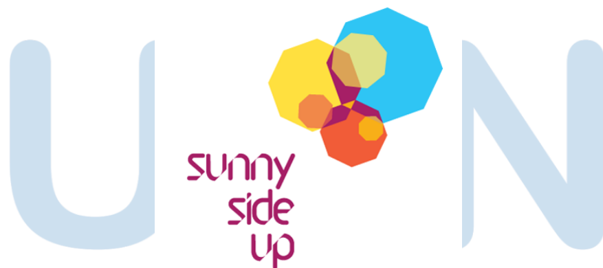
Gambar 2.1 Logo PT. Sunny Side Up

Awal mulanya. Render Post dan Render Digital Indonesia memberikan layanan jasa pasca produksi. Namun, Render Post memberikan layanan seperti Online Editing, Offline Editing, Grading, 3D, Grafis, dan Audio Post . Sedangkan Render Digital lebih berfokus pada layanan perestorasian film. Hingga pada tahun 2013, Render Post berganti nama menjadi Sunny Side Up, dan melayani Online Editing, Grading, 3D, dan juga Grafis . Sedangkan Render Digital tetap melayani restorasi film.