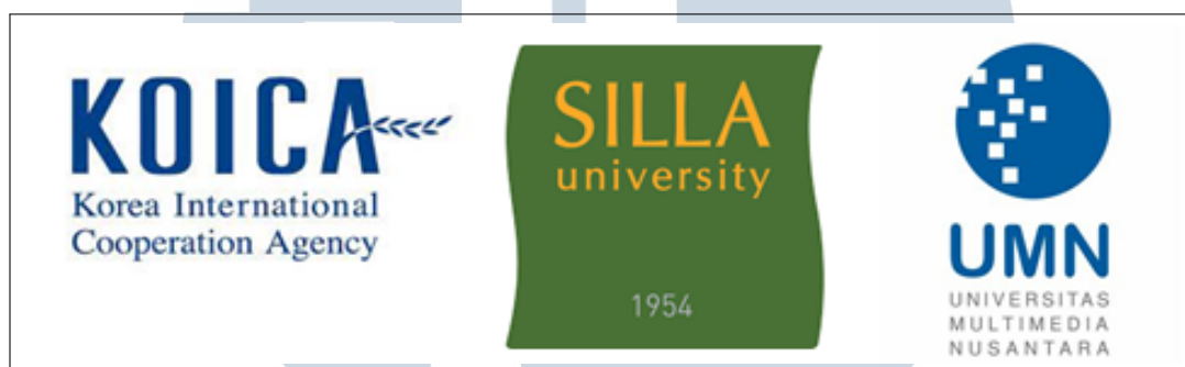
Gambar 2.2. KSU 4IRTC

Pada tahun 2021, KOICA bekerja sama dengan Silla University dan UMN menjalin kerja sama dengan mendirikan program KSU 4IRTC. Program ini dikhususkan untuk meningkatkan perkembangan SDM Indonesia dan juga perkembangan Indonesia khususnya pada bidang Smart Factory dan Cloud & Big Data .