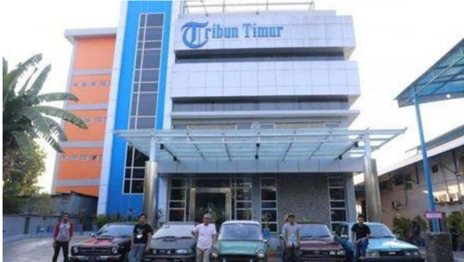
Gambar 2. 4 PT Tribun Digital Online Makassar

Pada gambar 2.2 merupakan gambar dari PT Tribun Digital Online yang berada di kota Solo