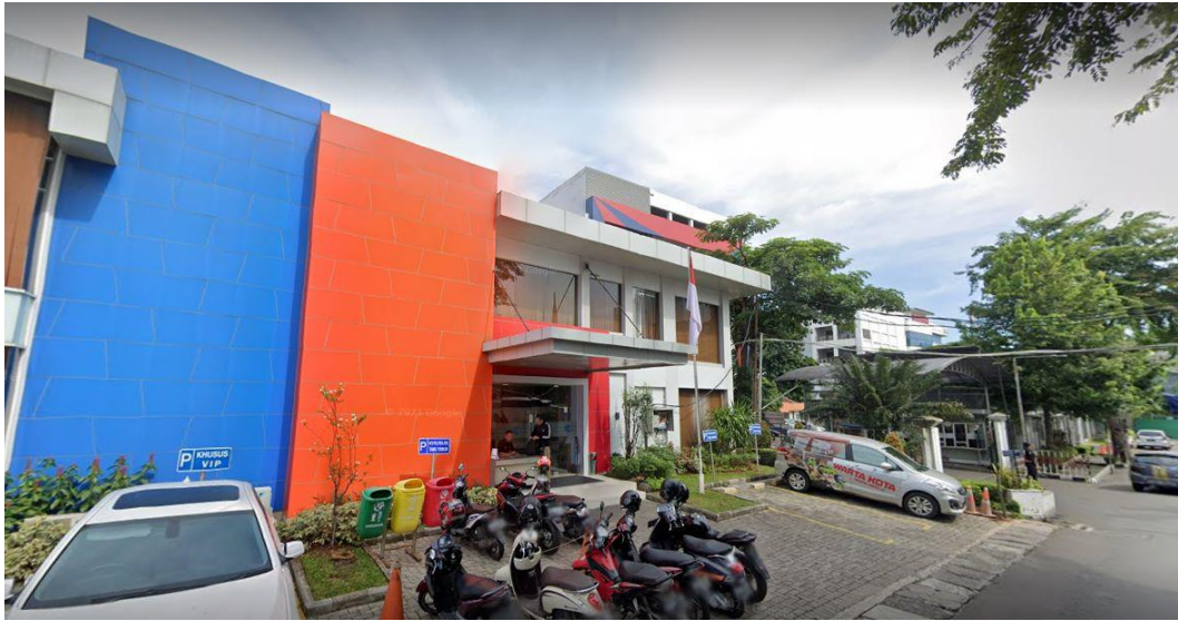
Gambar 2. 2 PT Tribun Digital Online Jakarta

Pada gambar 2.1 merupakan gambar dari PT Tribun Digital Online yang berada di Jl Palmerah Selatan No. 14, Kota Jakarta Pusat, DKI Jakarta.