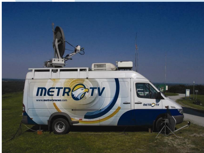
Gambar 2.2 Mobil SNG