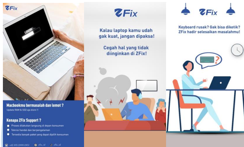
Gambar 3.2.2 Desain tentang masalah yang dihadapi laptop