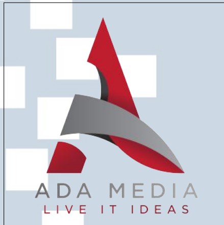
Gambar 2.1. Logo Perusahaan PT Dwi Natta Arya

PT Dwi Natta Arya atau yang lebih sering dikenal dengan nama ADA Media merupakan perusahaan yang didirikan pada tahun 2011 dengan tujuan utama menjadi solusi dari setiap kebutuhan klien serta dapat mendukung segala keperluan event , actiation , dan production . Seiring dengan berjalannya waktu, ADA Media semakin melebarkan sayapnya untuk menjadi perusahaan penyedia jasa "One Stop Event Organizer" dimana segala kebutuhan campaign dari inisiasi awal hingga hasil eksekusi pelaksanaan dapat dipercayakan pada perusahaan ini.