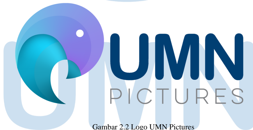
Gambar 2.2 Logo UMN Pictures

UMN Pictures atau MDN merupakan sebuah rumah produksi yang tergabung dalam Kompas Gramedia Group, yang bergerak dalam bidang industri animasi, film , game , dan desain. UMN Pictures terbagi dalam 3 divisi yaitu Creative Studio , Animation Studio , dan Game Studio . Creative Studio akan bertugas dalam membuat story dengan output IP , Project Manager dari Creative Studio adalah Ibu Yunita Winata. Animation Studio akan bertugas dalam mendukung game studio , dalam animation studio juga terdapat berbagai tugas kerja seperti 2D, modeler , rigging , animation , VFX , render , editing , untuk Project Manager Animation Studio adalah Bapak Juan Tan Chi Guan. Game Studio akan bertugas sebagai programmer atau memasukan project yang sudah dibuat ke dalam game engine yang selanjutnya akan diprogram sesuai dengan tujuan akhir project tersebut, dan untuk Project Manager dari Game Studio adalah Bapak Hadi Wongso. Untuk projection mapping bersama MDN, penulis dan rekan-rekan magang langsung berada di bawah Ibu Sandy sebagai supervisor yang akan memberikan masukan, menyetujui serta membantu kita selama mengerjakan project bersama MDN.