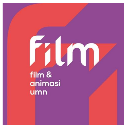
Gambar 2.1 Logo Program Studi Film

Sejarah program studi film Universitas Multimedia Nusantara. Pada tahun 2006, tepatnya pada tanggal 20 November Universitas Multimedia Nusantara secara resmi telah berdiri dengan 4 fakultas yaitu Fakultas Seni & Desain, Fakultas Informasi dan Teknologi, Fakultas Ilmu Komunikasi, dan Fakultas Ilmu Ekonomi. Pada tahun 2007, Fakultas Seni & Desain memulai kuliah perdana dengan dua peminatan yaitu Desain Grafis dan Animasi di bawah naungan Program Studi Desain Komunikasi Visual. Pada tahun selanjutnya yaitu 2008, Fakultas Seni & Desain kembali menambahkan satu peminatan baru yaitu Sinematografi di bawah naungan Program Studi Desain Komunikasi Visual. Pada tahun 2016, Fakultas Seni & Desain terbagi menjadi 3 Program Studi yaitu Desain Komunikasi Visual, Film dan Televisi, dan Arsitektur hingga saat ini dengan peminatan tiap Program Studi sebagai berikut, untuk Program Studi Desain Komunikasi Visual terbagi menjadi dua peminatan yaitu Desain Grafis dan Interactive Media Design, sedangkan untuk Program Studi Film dan Televisi terbagi menjadi dua peminatan yaitu Film dan Animasi.